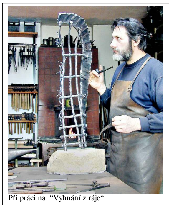
Při práci na „Vyhnání z ráje“

narozen 7. 1. 1958, vyučen v oborech strojní zámečník a umělecký kovář. Koncem 90. let absolvoval mistrovskou školu sdružení Rudolfinea na SOU uměleckořemeslném v Praze v oboru umělecký kovář – restaurátor s mistrovskou prací „Novorenesanční kování“. V roce 2001 studoval v Centro europeo di Venezia per i mestieri della conservazione del patrimonio architettonico v Benátkách. Roku 2003 získal certifikát po složení mistrovské zkoušky a titul „mistr uměleckého řemesla“. Od roku 1988 se zúčastnil v kategorii vystavovaných a demonstrováných prací na mezinárodním setkání uměleckých kovářů Hefaiston. V letech 1989 - 2001 zde byl pravidelně oceňován, několikrát nejvyššími cenami (např. hlavní cena za dílo „Zaručená zpráva /1994/, hlavní cena za dílo „Vymezený prostor“ /1993/, mimořádná cena za dílo „Jurská parodie“ /1994/, vykované v průběhu tzv. Kovářského fóra, 1. cena za vystavené dílo „Novorenesanční kování“ /2000/, 2. cena za demonstrováné dílo „Fénix“ /2000/, 2. cena za