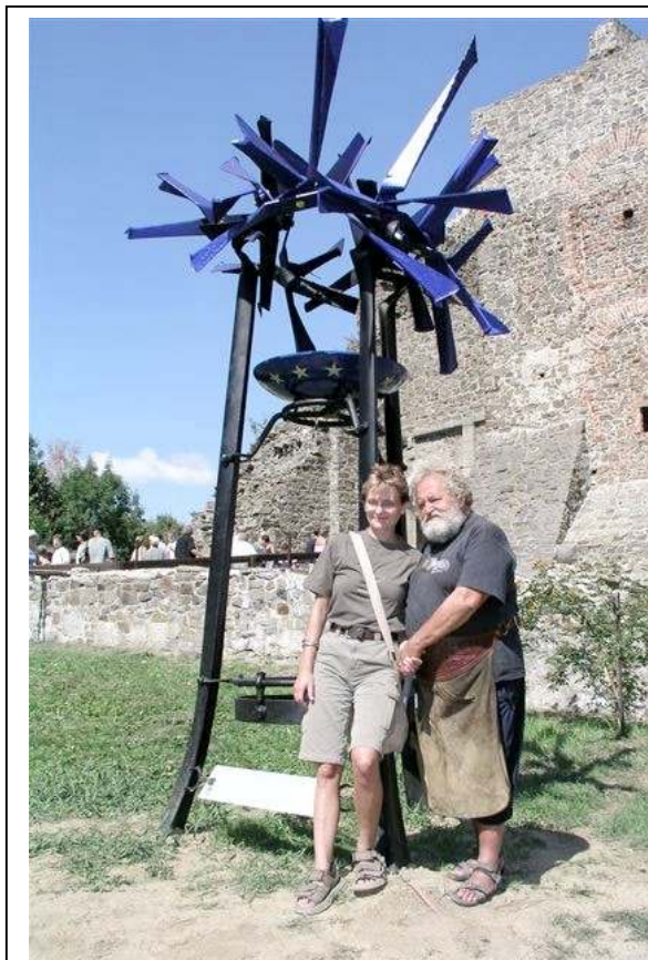
S hotovým dílem

Každoročně se na Helfštýn sjede kolem pěti set registrovaných účastníků, tj. kovářů, studentů a uměleckých teoretiků asi z patnácti států z celého světa. Návštěvnost veřejnosti během akce za sobotu a neděli dosahuje pravidelně kolem 10 000 osob. Mezi nimi je ovšem také spousta kovářů, kteří se jdou „jenom podívat“.