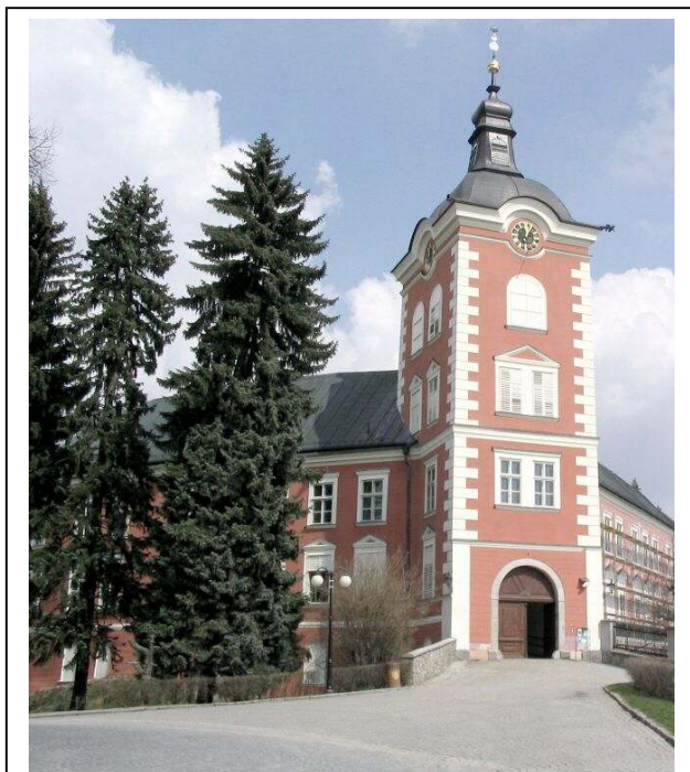
Zámek v Kamenici nad Lipou

Naše vrcholná sbírková instituce v oblasti užitého umění – Uměleckoprůmyslové muzeum v Praze se, podobně jako mnohá jiná muzea, po dlouhá léta potýkala s nedostatkem depozitárních prostor pro uložení narůstajících sbírek. Protože se nepodařilo získat prostory pro studijní depozitáře v hlavním městě, využilo muzeum roku 1998 nabídnuté možnosti v Kamenici nad Lipou, kde se v zámku uvolnily prostory po zrušení dětské ozdravovně. V prvním patře budou zřízeny studijní depozitáře nábytku, zejména 19. a 20. století, textilií a dalších materiálů. Po obnově renesančního, barokně a klasicistně přestavěného, zámku byla v přízemí východního křídla otevřena v roce 2004 první část expozice Kované železné práce ze sbírek UPM.