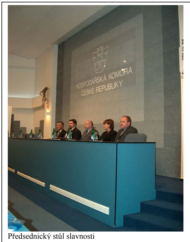
Předsednický stůl slavnosti